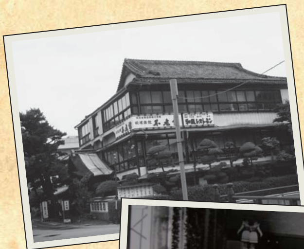
↑ 不老橋の傍にあった、 和歌浦の老舗旅館 不老館です。

カメラが高級品だったころに残された貴重な昔の写真は、 私たちの記憶をカタチにしてくれます。 昔から今へ、そして、未来へ。 ふるさとわかやまの貴重な写真を募集しています。