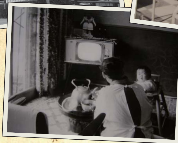
← 昭和35年代の我が家の居間 白黒のブラウン管式TVがお茶の間に 登場したころです。

提供して頂ける写真は紙プリントでも結構です。 画像データに返還後、御返却致します。