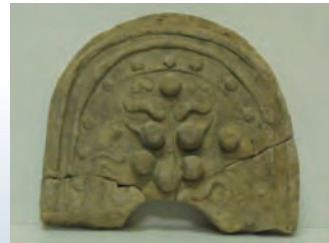
紀伊国分寺跡出土の瓦類 (紀の川市歴史民俗資料館蔵)