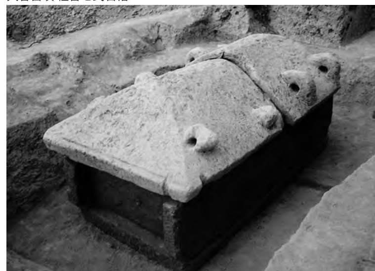
大谷古墳 組合せ式石棺