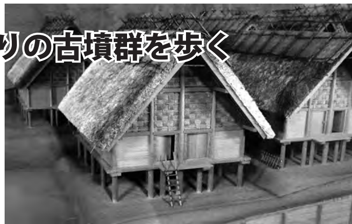
鳴滝遺跡倉庫群復元模型「大谷古墳説明板」より