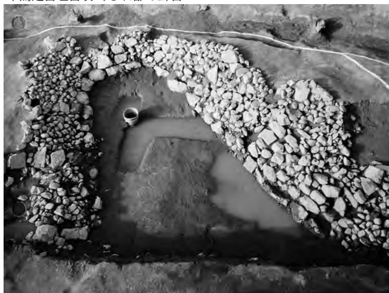
車駕之古址古墳 くびれ部の葺石