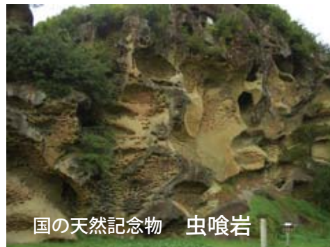
国の天然記念物 虫喰岩